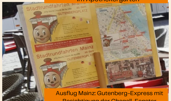
Ausflug Mainz: Gutenberg-Express mit Besichtigung der Chagall-Fenster