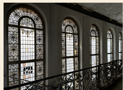
Das Alte Polizeipräsidium Frankfurt von innen