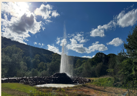
Ausbruch des Kaltwasser-Geysirs in Andernach