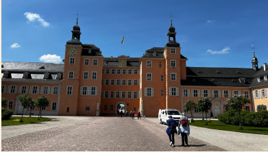
Das Schloss in Schwetzingen