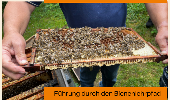
Führung durch den Bienenlehrpfad im Apothekergarten