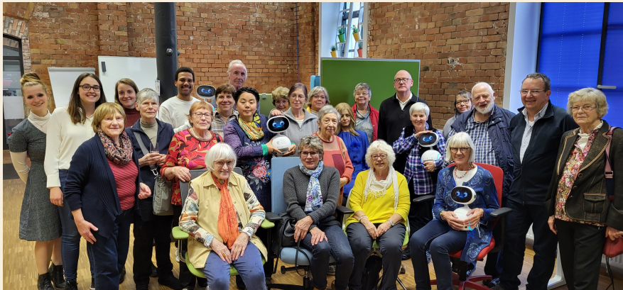
Gruppenfoto im leap in time Darmstadt