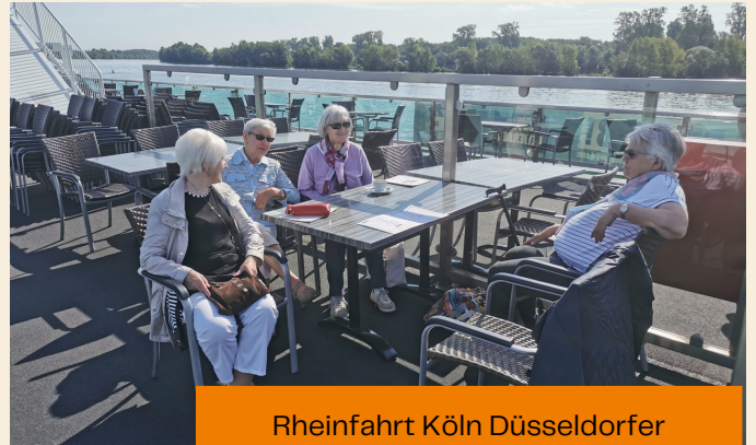
Rheinfahrt Köln Düsseldorf