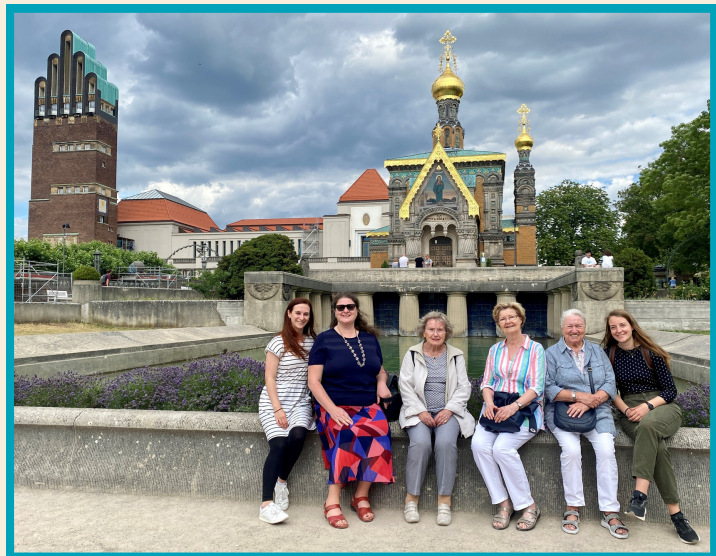
Betriebsausflug des AK nach Darmstadt mit Führung auf der Mathildenhöhe im Juni 2023.

Aktive Mitglieder sind: Vertreter*innen der Stadt Wiesbaden – Abteilung Altenarbeit, Ringkirche, Lutherkirche, Diakonisches Werk, Kirchenfenster Schwalbe6, GWW Wiesbaden, Netzwerk55Plus und Johanniter Unfallhilfe.