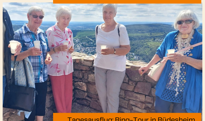
Tagesausflug: Ring-Tour in Rudesheim mit improvisiertem "Weintasting"