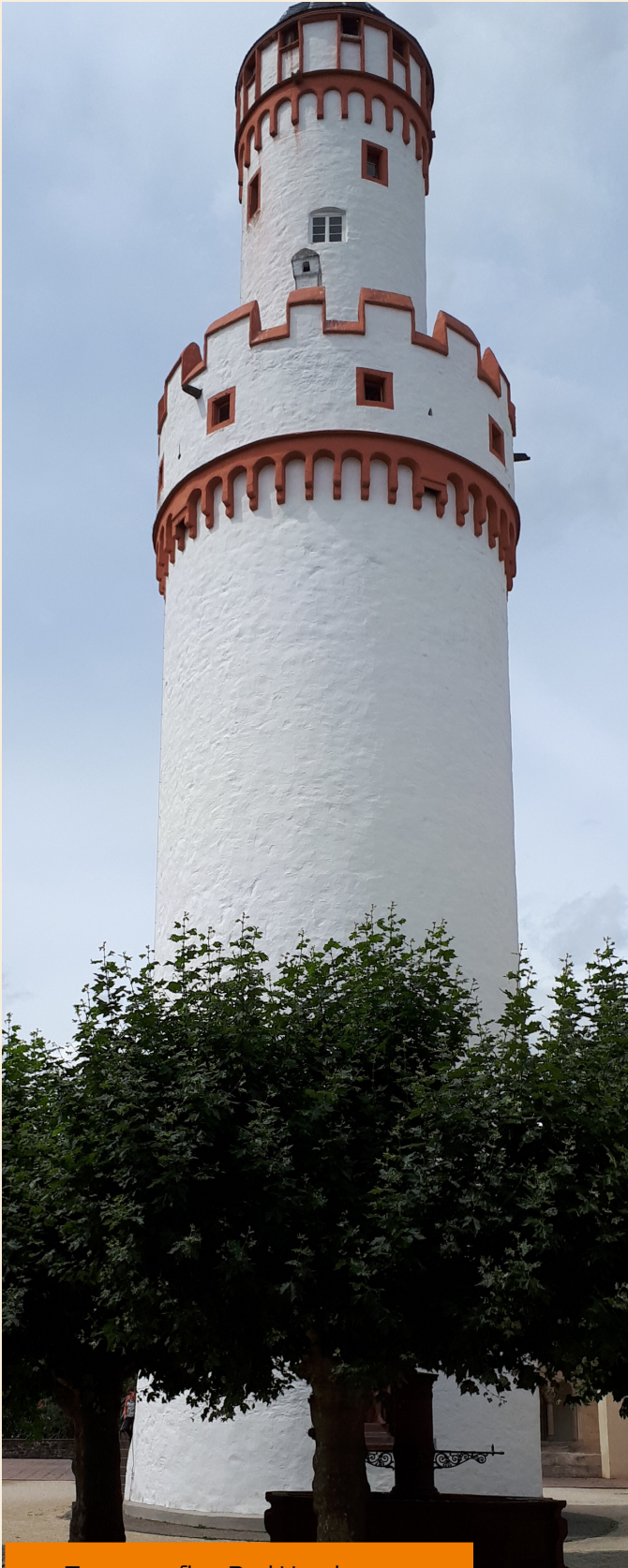
Tagesausflug Bad Homburg