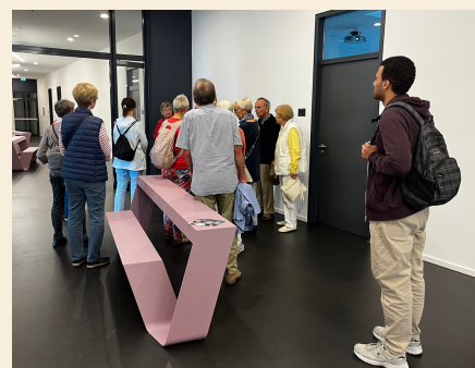
Besichtigung der Hochschule Fresenius in der Moritzstraße